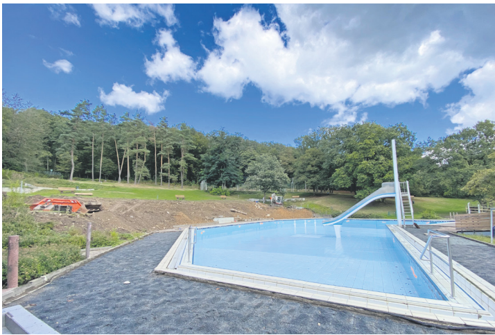
Das Waldschwimmbad

Im Oktober steht der nächste größere Schritt an: Dann werden die neuen Edelstahl-Auskleidungen der Schwimmbecken eingebaut. Mittlerweile sind auch die letzten Aufträge für die 6,3 Millionen Euro teure Sanierung vergeben, nämlich für das Gewerk „Badewassertechnik“. Details zur Schwimmbadsanierung finden sich auf der Webseite der Gemeinde: https://www.niedernhausen.de/verwaltung-politik/aktuelles/news/stoepsel-raus-schwimmbad-sanierung-in-niedernhausen-beginnt/