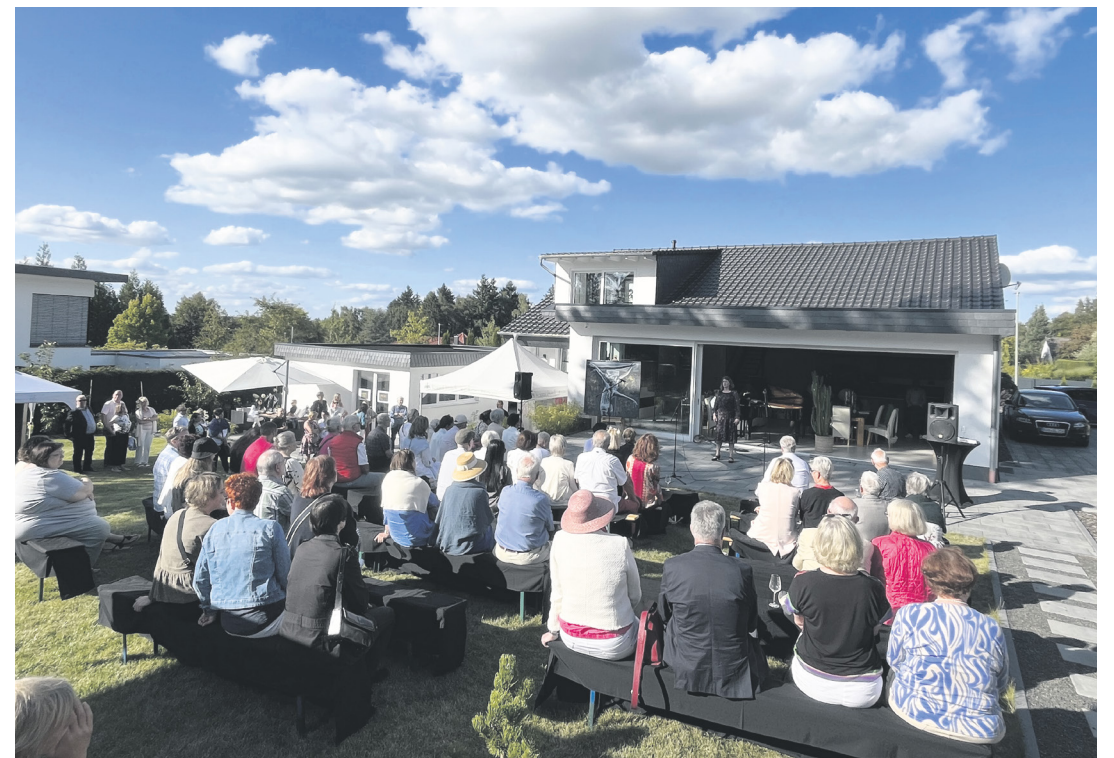
Kunst im Garten mit vielen Gästen

Alles in allem ein erlebnisreicher und dem Titel folgend berührender Nachmittag, wie die zahlreichen Anwesenden im Gästebuch notierten. Der Sommergarten 2025 voller Kunst ist für den 17. August 2025 geplant.