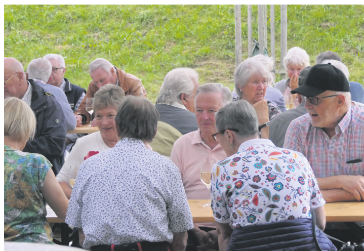
Beim Sommerfest der CDU