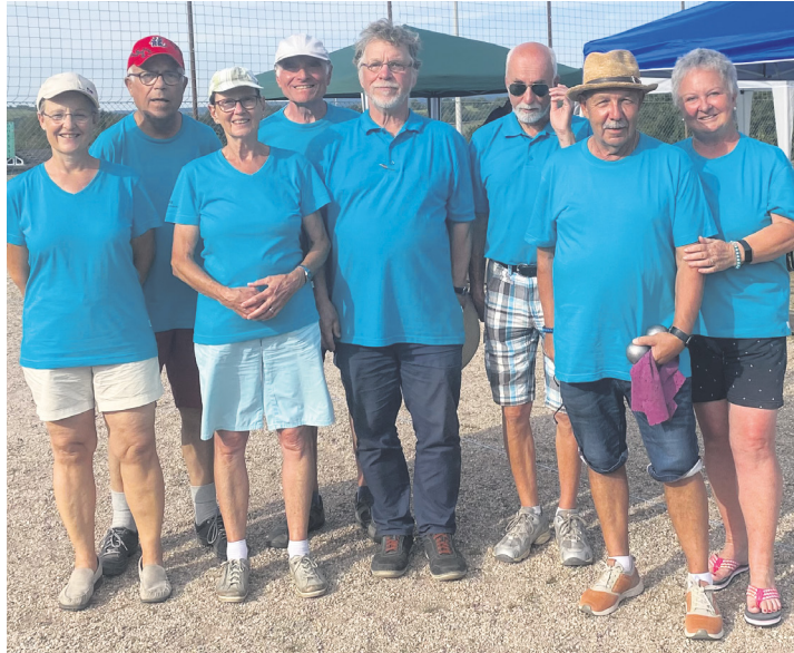
Allez les boules

ten wir ein positives Fazit zur abgelaufenen Saison ziehen: Wir hatten eine tolle Stimmung in unserer Mannschaft und es sind Freundschaften mit anderen Vereinen entstanden. Aufgrund der oft sehr knappen Spielergebnisse können wir in dieser Liga mithalten und freuen uns schon auf die Saison 2025.