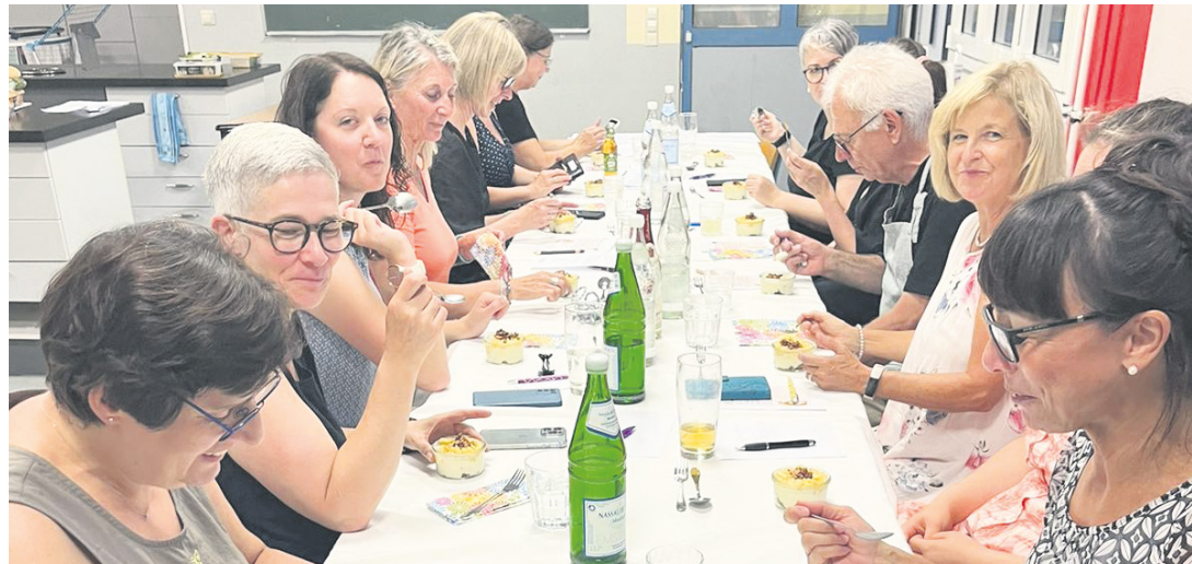
Nach dem Kochen schmeckt es gut

Ehrenamtliche Arbeit ist wichtig - und für Familien mit einem schwerkranken Kind unerlässlich. Die Tätigkeit der ehrenamtlich Mitarbeitenden des Ambulanten Kinder- und Jugendhospizdienstes (AKJHD) von Bärenherz besteht aus aufsuchender Arbeit in den Familien. Es werde mit den kranken Kindern gespielt oder es werde