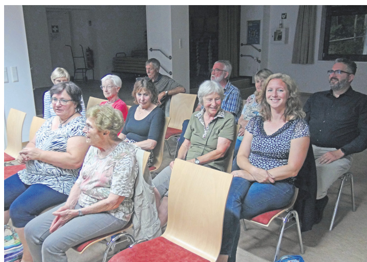
Großes Interesse am Vortrag über Hornissen

Ein Nest wurde 2023 im Wildpark von Engenhahn entdeckt. Die Entfernung muss unbedingt von einem Fachmann durchgeführt werden, da sich im Nest befindliche Tiere das Nest verteidigen. Es gilt also hier besondere Vorsicht! Für Menschen, die allergisch auf Insektenstiche reagieren, können Stiche der Asiatischen Hornisse lebensbedrohlich sein. So war in einem Vortrag zu hören, zu dem der örtliche NABU in die Alte Schule von Königshofen eingeladen hatte.