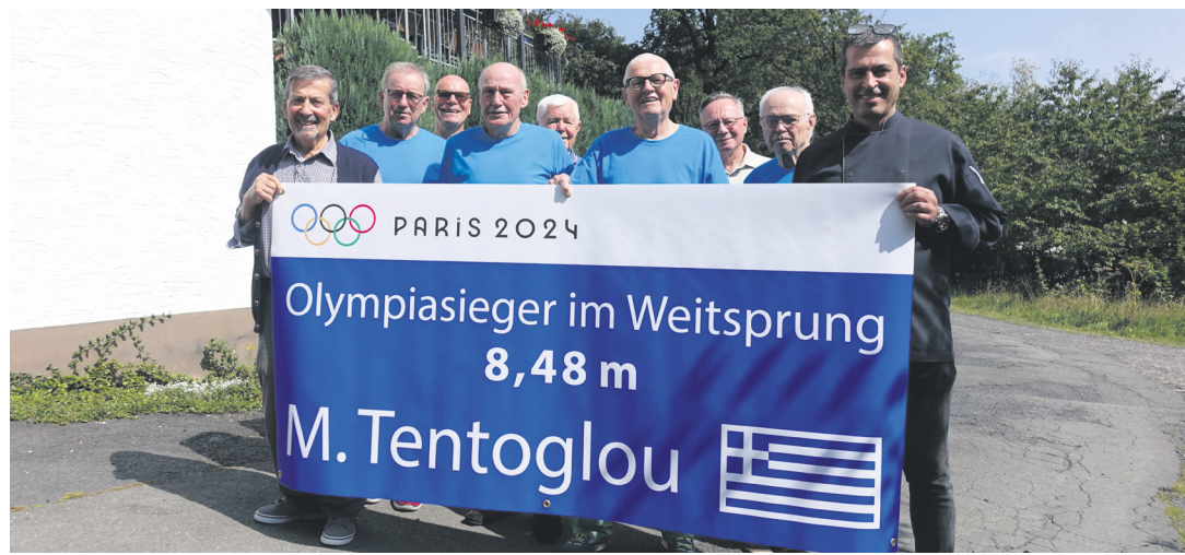
Eine besondere Anerkennung für Miltiadis Tentoglu, dem Goldmedaillengewinner von Paris

Natürlich konnte noch niemand ahnen, dass aus ihm einmal ein zweifacher Olympiasieger, Welt- und Europameister werden würde. Auch die Sprunggrube auf dem Gelände des TuS wurde für ihn für Übungssprünge aufgedeckt. Um diese enge Verbundenheit mit der Familie Tentoglu zu dokumentieren – insbesondere von der Funktionellen Sportgymnastik des TuS Königshofen, und damit den außerordentlichen sportlichen Erfolg zu honorieren, schmückten die Sportler der Gruppe am vergangenen Freitag die Terrasse der Gaststätte Schützenhaus mit einem „Ehrenbanner“.