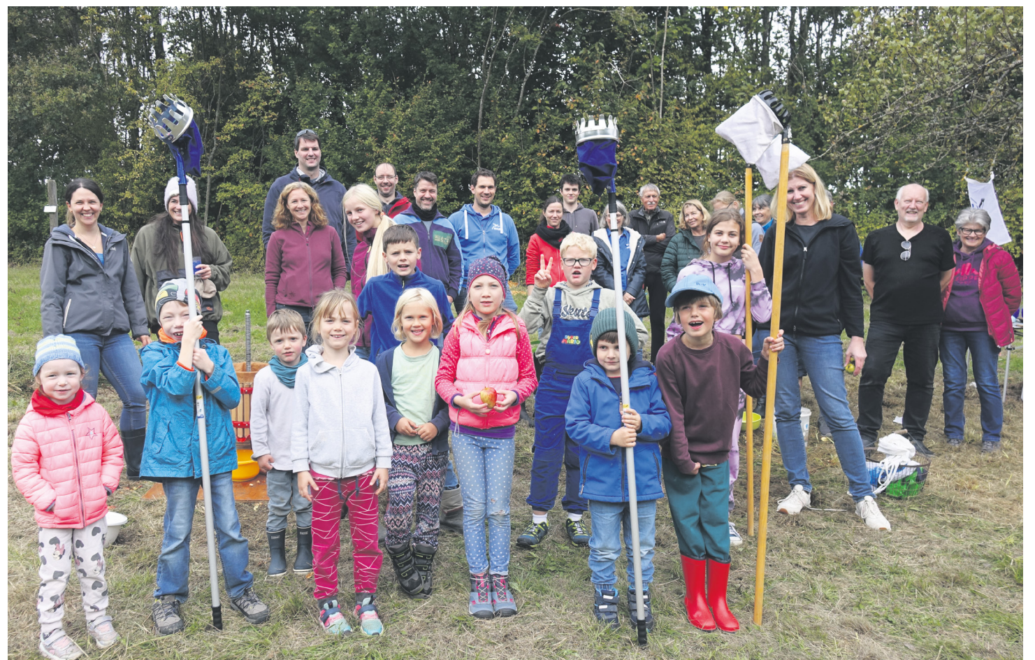
Zu einem aktionsreichen Familiennachmittag wurde das Keltern auf der Streuobstwiese des NABU

den Vätern nach. Nun nur noch der süße Most probiert – herrlich. Neben dem leckeren Saft wartete auch ein schmackhafter Apfelkuchen als feste Ergänzung zum süßen Most. Eifer, Freude und die Begeisterung waren zu spüren, die die Kinder – und nicht nur sie – bei ihrer Saftproduktion hatten. So wissen sie nun ohne Zweifel, wie der Apfelsaft entsteht. Eberhard Heyne