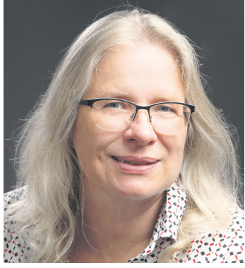
Frau Nisters von der Buechereule empfiehlt: