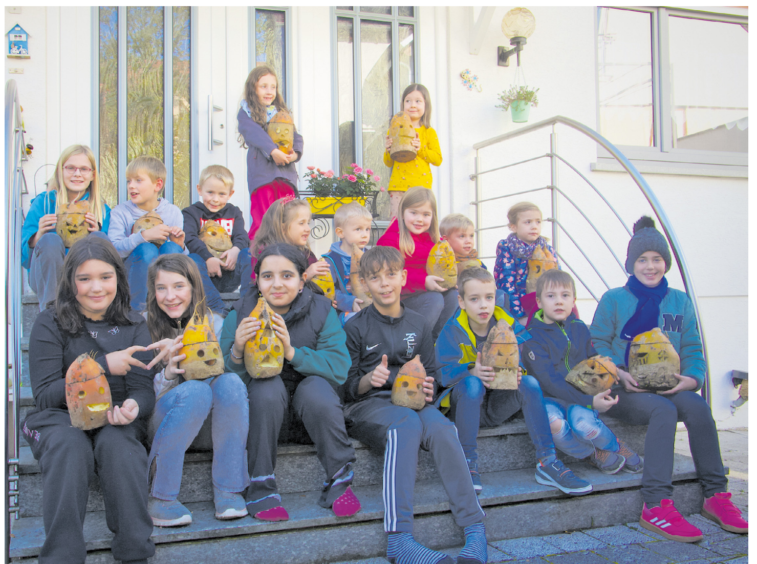
Finale Präsentation der Dickwurzschneiderein