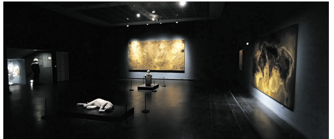
Ausstellungsraum mit Werken von Toni R. Toivonen im Kontrast zu Abgüssen aus Pompeji

Eine kleine, aber sehr feine Ausstellung wird zurzeit (12.10.2024 bis 2.3.2025) in den Räumlichkeiten des Frankfurter Kunstvereins präsentiert. Die Ausstellung „Das Anwesende des Abwesenden | Materie und Spuren – Abdrücke des Lebens in der Zeit“ kreist thematisch um die zeitlose Auseinandersetzung des Menschen mit der Idee der Veränderung und der Vergänglichkeit und deren Formen der Repräsentation. Der Titel spielt auf Materie als Präsenz an, in der sich Spuren des Lebenden einschreiben. Die vitale Energie ist kraftvoll, jedoch flüchtig. Woher kommen wir? Was ist der Ursprung aller Materie auf der Erde und in der Unendlichkeit des Kosmos? Was bedeutet es, in unserer Galaxie Schwarze Löcher zu erkennen, in denen unendlich verdichtete Materie eine Leere und Abwesenheit