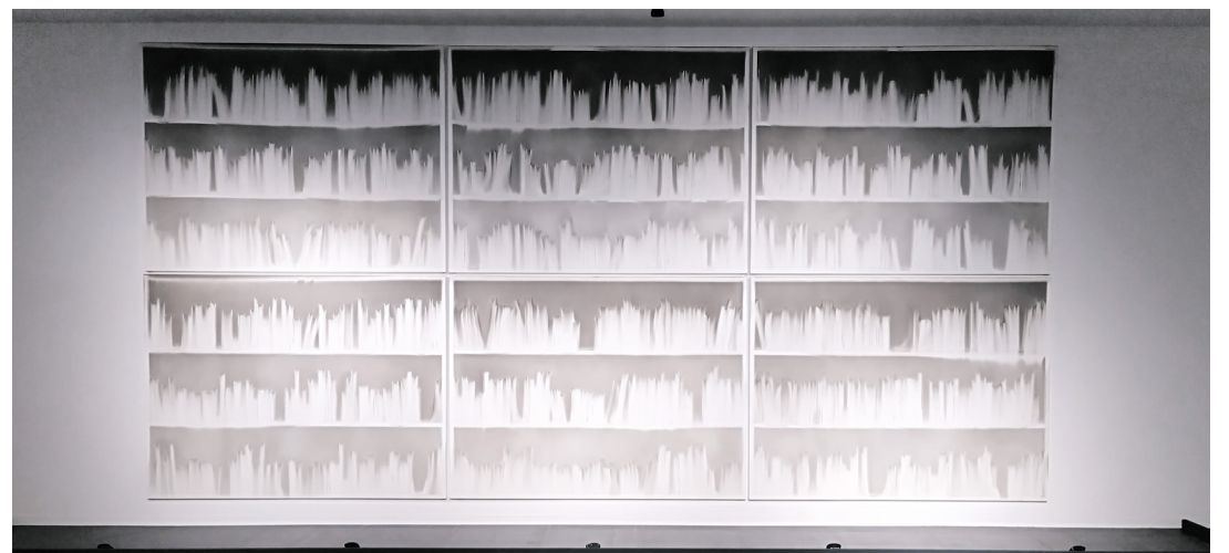
Eines der Rußbilder von Claudio Parmiggiani, die durch Rauchablagerungen in einer Feuerkammer entstehen

zeitgenössischer Künstler:innen treten in einen Dialog mit wissenschaftlichen Exponaten der Geologie, der Astrophysik, mit Fußabdrücken prähistorischer Menschen von der Fundstelle Laetoli im heutigen Tansania und mit Nachbildungen prähistorischer Höhlenzeichnungen menschlicher Vorfahren. Alle Exponate verweisen auf existenzielle Fragen des Menschseins in den Dimensionen von Raum und Zeit. Sie erforschen die Idee der Spuren einer Existenz, die sich in Materie einschreiben. Öffnungszeiten: Di-So: 11–19 Uhr Do: 11–21 Uhr Eintrittspreise: 10 € regulär, 6 € ermäßigt Ermäßigter Eintritt für Gruppen (ab 8 Personen): 8 € pro Person, Student:innen und Schüler:innen: 4 € pro Person