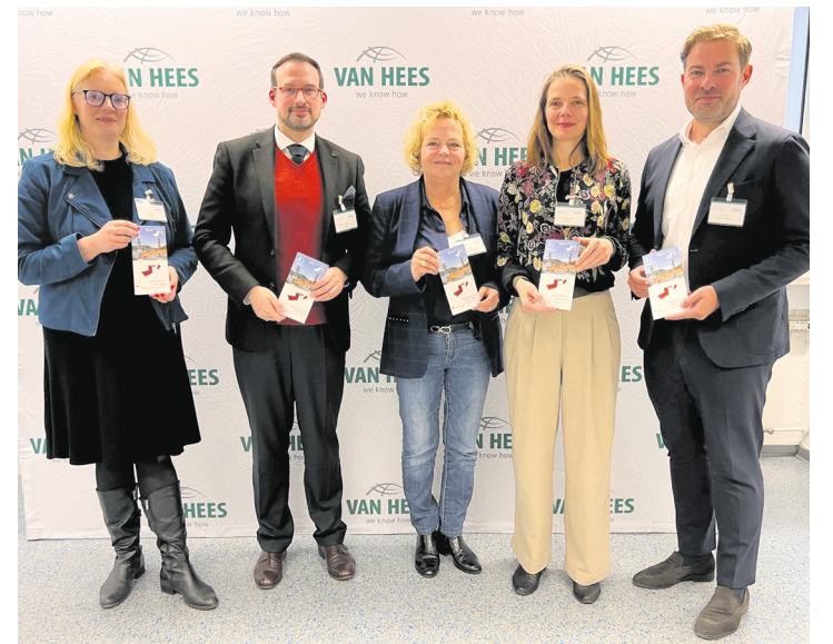
Präsentation des Industriekultur-Routenführers