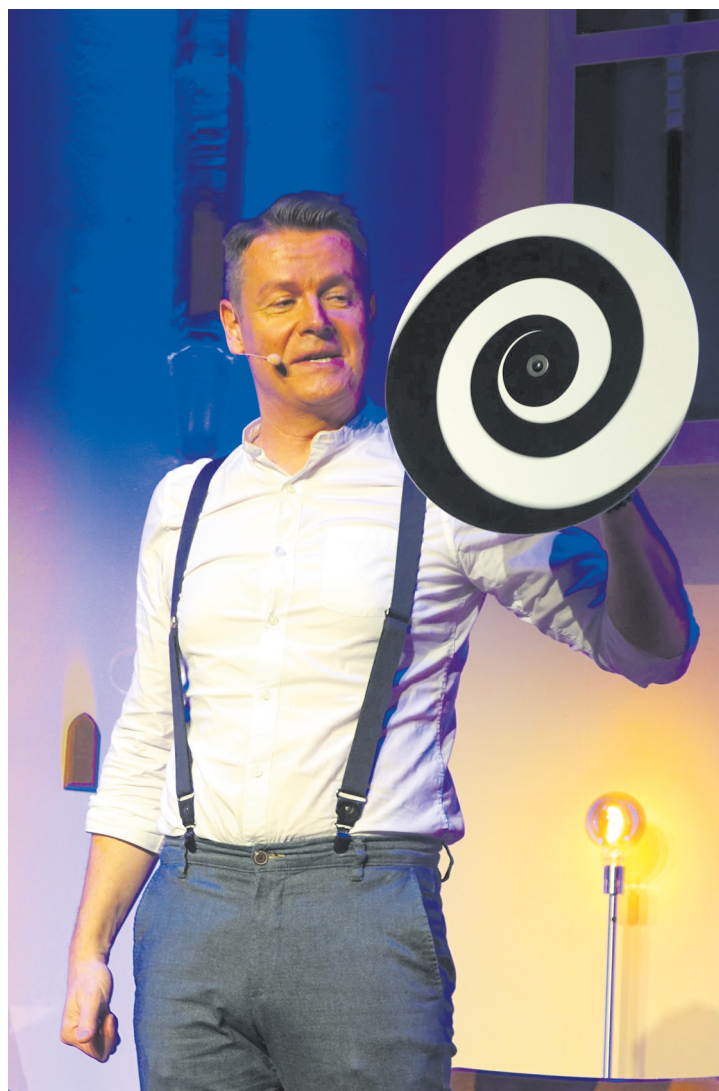
Lars Ruth täuscht mit einer Spiralscheibe alle auf ihn gerichteten Augen der Besucher

gewöhnliches ankündigte - den, wie er sich nennt, Mentalisten Lars Ruth - mit einigen wenigen Utensilien auf der Bühne. Seine Show, so lässt er gleich zu Anfang wissen, ginge nur mit Menschen aus dem Publikum - da mangelte es denn auch nicht an Freiwilligen, die keine Bühnenscheu hatten. Gibt es Gedankenübertragung, ist Kinetik, also unerklärlicher Körperdruck, möglich, schickt Hypnose auf eine Zeitreise oder zeigen Pendel die Wahrheit? Tatsächlich wartete auf die Besucher zunächst Unerklärliches, das in der Pause oder am Ende der Show in Diskussionen versucht wurde, zu verstehen. Dass der Künstler Lars Ruth Dinge kann, deren Zusammenhänge und Ergebnisse sich einem nicht erschließen, ist unbestritten. Nur wie macht er das? Eine wenig lässt er hinter die Kulissen schauen. Beim Versprechen, allen das Gedankenlesen beizubringen. Ein „Medium“ denkt sich eine Zahl auf einem Würfel aus, legt diesen mit dieser Zahl nach oben - für alle nicht sichtbar - unter einen Becher. In einem Schwall seiner Rede zeigen Finger des „Sehers“ dem Publikum die Zahl, das sie dann laut ruft. Das Medium ist verblüfft - alle können das! Erklärt das alles? Aber woher weiß Lars Ruth die Zahl oben auf dem Würfel und das 3 x richtig? Rätsel bleiben. Konzentration, so ein Hilfsmittel, sagt der Künstler, soll zur Gedankenübertragung führen können. Aus der Auswahl dreier Bücher