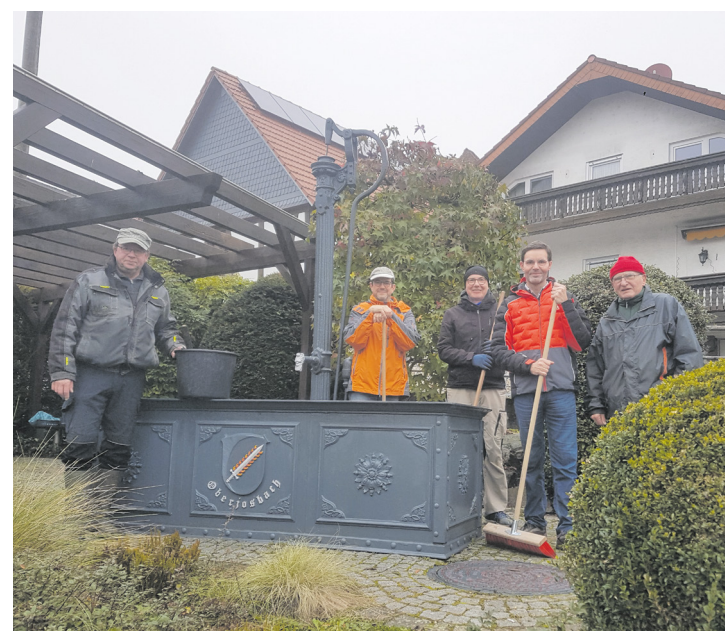
Die „letzte Schicht“

Am Samstag, 9. November 2024, fand die letzte „Pflegeschicht“ am Oberjosbacher Dorfbrunnen statt. Der Winter kann kommen. Der Trog ist gesäubert, der Deckel sitzt auf dem Brunnenrog und die Anlage ist gepflegt. Ehrenamt ist die Seele des Brunnens, vom Bau 2003 bis heute. Sechs Pflegeeinsätze in 2024 waren zu leisten. Die laufende Betreuung, Technik und Wasser, nicht mitgerechnet, auch die Bereitstellung von Kaffee und Kuchen für die Pfleger/Pflegerinnen nach jedem Einsatz durch Familie Schlögl sei lobend erwähnt. Der Förderverein 800 Jahre Oberjosbach e. V., als Träger der Anlage, dankt ganz herzlich. Das Tor zur Mitarbeit steht immer offen. Im Jahre 2025 wird die Brunneneröffnung am Sonntag, 30.3.2025, stattfinden. Der Förderverein freut sich schon auf den Osterschmuck der Anlage durch die Gruppe „Bärenstark“ der Kerbegesellschaft. Als großen Arbeitspunkt für 2025 steht die Erneuerung der Pergola aus Holz nach 21 Jahren auf dem Programm. Hier hofft der Förderverein auf die Unterstützung aller Oberjosbacher.