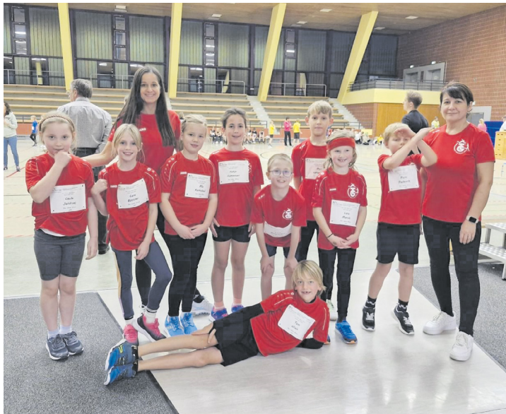
Die Leichtathletik-Kinder der TG Niedernhausen bei der Kila Liga in Kriftel

sem Erfolg bei. Das U10-Team konnte den 8. Platz erreichen. Obwohl die Konkurrenz in dieser Altersklasse besonders stark war, zeigte das Team aus Niedernhausen Durchhaltevermögen und großen Ehrgeiz. Es war deutlich zu sehen, wie viel Spaß die jungen Athleten bei den verschiedenen Disziplinen hatten, was sich positiv auf ihre Leistungen auswirkte. In der Gesamtwertung des Kreisliga-Wettbewerbs konnte die Kooperation zwischen der TG Niedernhausen und der LG Main-Taunus West einen beachtlichen 5. Platz belegen. Dies ist ein großartiger Erfolg für das gemeinsame Projekt und zeigt die gute Arbeit der Trainer. Die Trainerinnen und Trainer beider Vereine haben die Kinder mit Unterstützung der Eltern optimal auf die Kila Liga vorbereitet. Für die Zukunft ist man als LG Main-Taunus West zuversichtlich und motiviert, weiterhin gemeinsam an der Entwicklung der jungen Talente in den einzelnen Vereinen zu arbeiten. Der Wettkampf in Kriftel hat gezeigt, dass die Zusammenarbeit sehr viel Potenzial bietet und auch in den kommenden Jahren zu weiteren Erfolgen führen könnte.