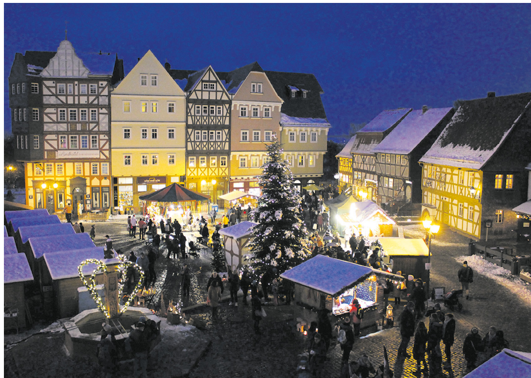
Adventsmarkt im Freilichtmuseum Hessenpark

Am ersten Adventswochenende können sich Weihnachtsfans auf dem Adventsmarkt im Freilichtmuseum Hessenpark auf die bevorstehenden Feiertage einstimmen: Bummeln in historischem Ambiente, Kunsthandwerk entdecken, Weihnachtsgeschenke einkaufen, nach Herzenslust schlemmen und das Rahmenprogramm für die ganze Familie genießen. Das Angebot an kulinarischen Köstlichkeiten ist groß. Zur Auswahl stehen unter anderem frische Kartoffeln aus der Dämpfkolonnen mit Raclettekäse und Cornichons, Dampfknudeln mit Vanillesoße, Waffeln, Käseespätzle, Baumstriezel, Crêpes, Bratwürste, Kaffeespezialitäten, Glühwein und vieles mehr. Am Samstag sorgt der Musikverein Obertiefbach e. V. von 16 bis