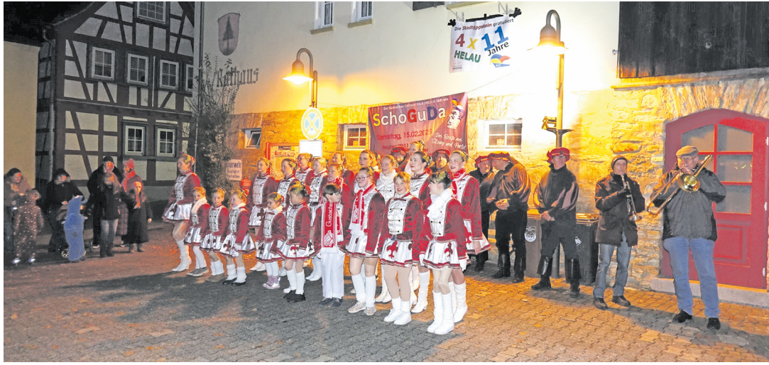
Machtlos ist die Rathausverteidigung gegen den geballten närrischen Charme

sich in Fesseln, die Stadtkasse unter dem Arm. „Ich geb’s ja zu, Ihr habt gewonnen und das Rathaus eingenommen“. Jubelgeheul beim Narrenvolk. „Liebe Freunde, das war klar, siegreich war die Narrenschar“. Ein kleinlauter Schultheiß jammert: „Was sein muss, muss halt sein – schaut ruhig in die Stadtkass’ rein“, und der Ortsvorsteher ergänzt: „Armes Gusbach, sei bereit – für Euch jetzt kommt die schwere Zeit.“ Aber die Eroberer zeigen sich großzügig: „Gemeinsam wollen wir es begießen, Euch die Gefangenschaft versüßen. Von nun an lasst uns lustig sein, bei Wasser, Bier und heißem Wein!“. So zog man gemeinsam und versöhnt ins Vereinsheim und feierte die Machtübernahme. 3 x Gusbach Helau! Eberhard Heyne