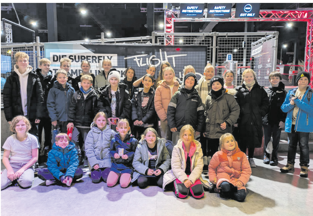
Ausflüge machen Freude

backen. Für das leibliche Wohl ist gesorgt – mit allem, was das Herz in dieser kalten, vorweihnachtlichen Zeit begehrt. Lassen Sie sich von den weihnachtlichen Düften, dem Glanz der Lichter und der adventlichen Stimmung vor der Kulisse der Fachwerkhäuser verzaubern! Der historische Wiegerraum im Alten Rathaus hat während des Marktes seine Tore geöffnet und lädt mit Sitzgelegenheiten zum Verweilen und Innehalten für besinnliche Momente ein. Der Vereinsring Oberjosbach freut sich auf viele kleine und große Besucher.