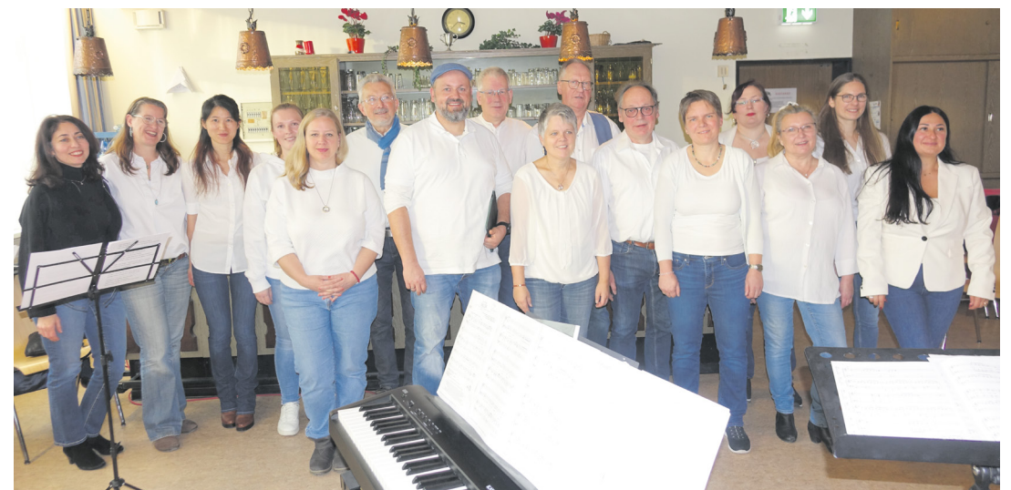
Der gemischte Chor Terzschlag sang zu einem Liedernachmittag