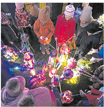
Die Quallen leuchten beim Laternenfest

Auch in diesem Jahr fand in der bilingualen Kindertagesstätte TASIMU e. V. das traditionelle Laternenfest statt. Bereits Wochen vorher bastelten die Kinder im Kindergarten – gemeinsam mit ihren Eltern – ihre Laternen in Form von leuchtenden Quallen mit bunten Tentakeln. Am 12. November war es dann soweit: Nachdem die Kinder die Geschichte von St. Martin erzählt bekommen hatten, kamen nach und nach die Eltern in die Einrichtung. Im Hof wur-