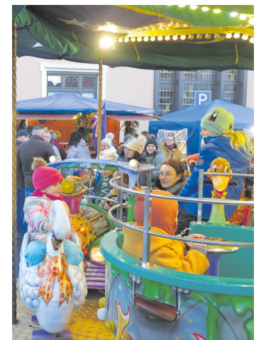
Natürlich war das Kinderkarussell die besondere Attraktion hinter dem Rathaus

GlühGin oder heißem Apfelsaft für die innere Wärme. Im ZAK warten Kuchen und ein herrlicher Kaffee mit Sitzplätzen zum Verweilen ein. Kunsthandwerkliches von Matthias Trapp oder Findkunst von Reinhold Reinish, Feines aus Bienenwachs von Martina Cremer, Modeschmuck von Jutta Winter-Dubbo, handgefertigte Accessoires von Nuran Karimpouris und in Uschis Häkelstube Häkelkunst in Vollendung mit Kuscheltieren, Puppenkleider und Handpuppen - da kann man herrlich stöbern und etwas für das Fest finden. Danach ist's genug mit weihnachtlicher Vorbereitung und ein Heimweg in Zufriedenheit wird angetreten. Eberhard Heyne