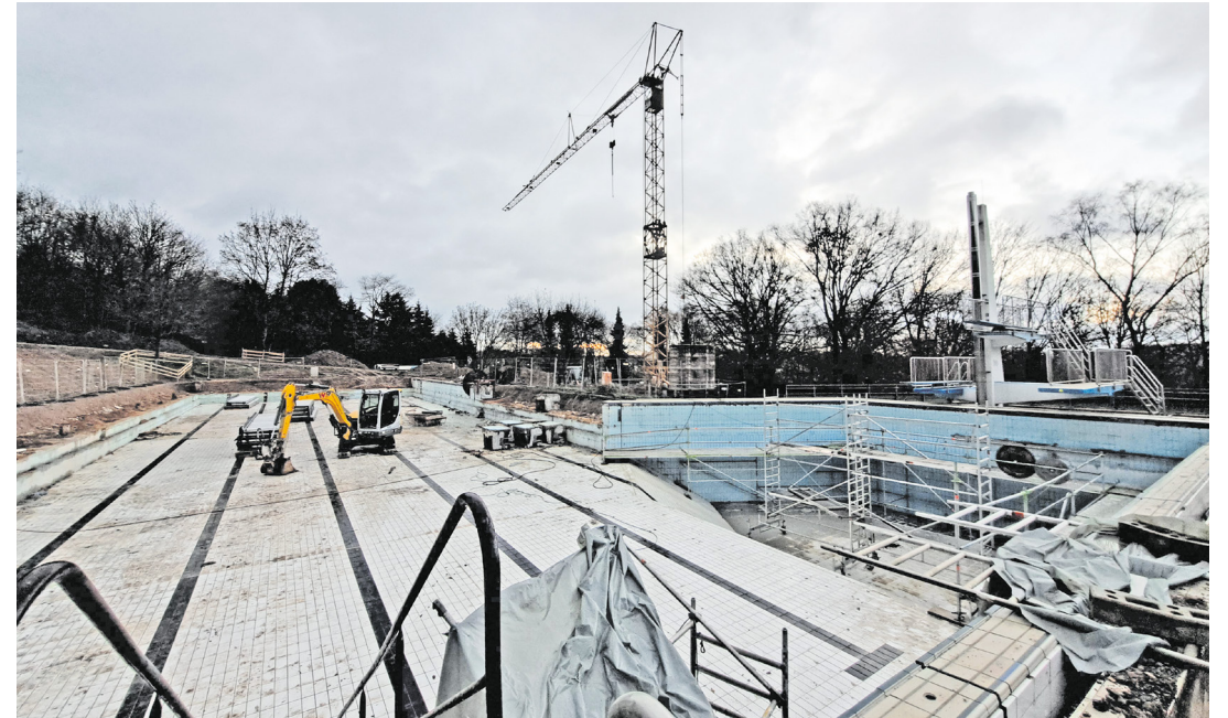
Betonarbeiten am Schwimmerbecken im Waldschwimmbad

über das Schwimmbadgelände. Anfang Dezember beginnen zusätzlich die Arbeiten an der erneuerten Badewassertechnik. Das Technikgebäude wird mit neuen Fenstern und Türen versehen. Die ersten Teile der neuen Becken sind bereits für das Nichtschwimmerbecken geliefert. Sehr bald schon wird man also erkennen können, wie die fertigen Becken einmal aussehen werden!