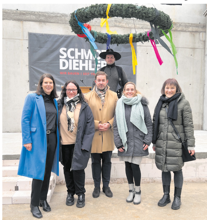
Richtfest in der Theißtalschule