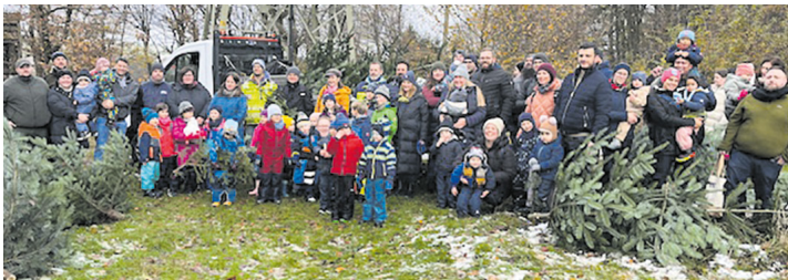
Tannenbaumaktion der Kitas

ren ehrenamtlich dafür, dass die geschlagenen Tannenbäume zu den einzelnen Einrichtungen transportiert werden. Sein Einsatz wird von allen Beteiligten sehr geschätzt. Der Vormittag klang bei warmen Getränken wie Kakao und Kinderpunsch sowie köstlichen Keksen aus. Dies bot eine Gelegenheit für Gespräche und einen gemütlichen Austausch unter Eltern und Kindern. Nun sind alle Kindergärten und Krippen in Niedernhausen mit prächtigen Tannenbäumen ausgestattet, die in den kommenden Tagen festlich geschmückt werden. Diese Aktion hat nicht nur die Vorfreude auf Weihnachten gesteigert, sondern auch den Zusammenhalt und das Gemeinschaftsgefühl zwischen Kindern, Eltern und Fachpersonal in den Einrichtungen weiter gestärkt.