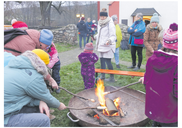
Feuer in der Feuerschale brät das Stockbrot

rena, Christine, Pia und Leonie – mit süßen Waffeln oder, rasch ausverkauftem Zwiebelkuchen richtig. Schließlich am Ende des Rundgangs eine Weile noch beim Kerbverein stehen bleiben – mit einem Becher heißem Apfelwein (mit oder ohne Amaretto) und für den Nachwuchs Kinderpunsch – ohne was Derartiges! Ein heimelig familiärer Adventsmarkt in Niederseelbach, an dem man sich gerne trifft, bei einander steht, Neuigkeiten austauscht und sich schlicht in vorweihnachtlicher Stimmung wohl fühlt. So war es auch dieses Jahr. Eberhard Heyne