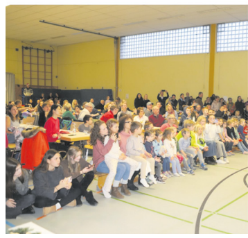
TV Niederseelbach AKTIV - auch bei der Weihnachtsfeier