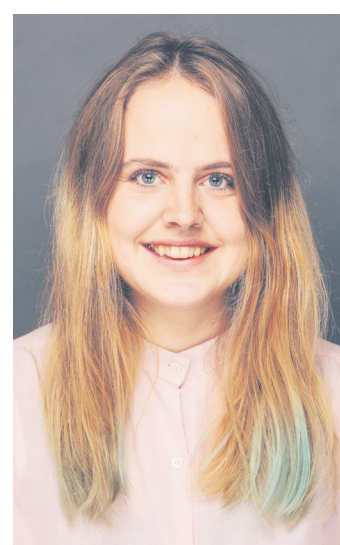
Frau Willigalla von der Büchereule empfiehlt: