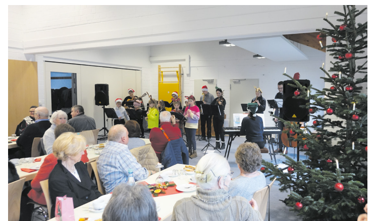
Die Musikgruppe St. Martha spielt weihnachtliche Weisen