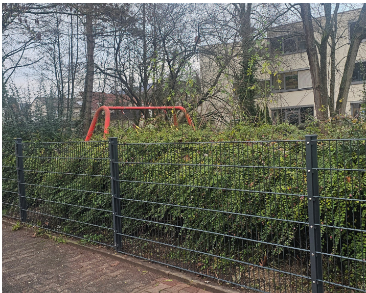
Der neue Zaun entlang der Straße Am Bündelberg, im Hintergrund ist das Rathaus zu sehen.

Die Sicherheit auf den Spielplätzen ist der Stadt Eppstein ein wichtiges Anliegen. Regelmäßige Kontrollen und Ausbesserungsarbeiten werden durchgeführt. Jetzt hat der zuständige Fachbereich einige Fallschutzflächen aufgefüllt. Für über 5.000 Euro sind Holzhackschnitzel angeschafft worden. Der am Spielplatz am Rathaus I in Vockenhausen vorhandene Jägerzaun entsprach nicht mehr den Sicherheitsvorschriften, was im Rahmen einer Kontrolle des technischen Prüfdienstes moniert wurde. Der Zaun entlang der Straße Am Bündelberg wurde rückgebaut und durch einen neuen Doppelstabgitterzaun auf rund 51 Metern ersetzt. Hierfür wurden rund 5.700 Euro investiert.