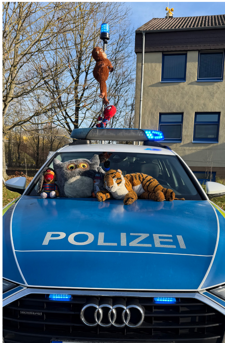
Dschungelbuch Ruchheim (Polizeidirektion Neustadt/Weinstraße)