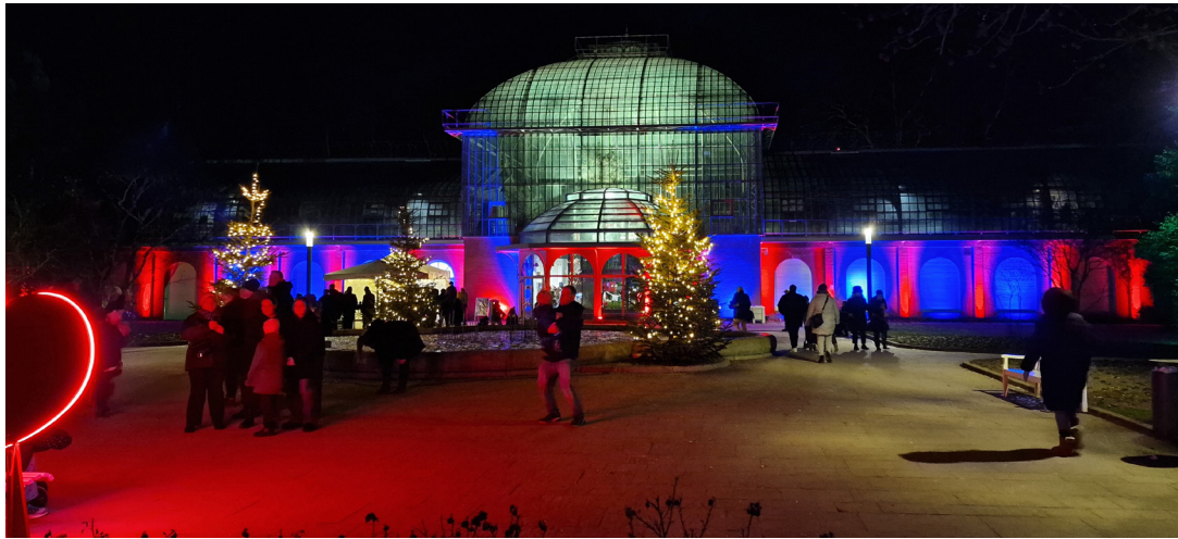
Winterlichter im Palmengarten

Die beliebte Veranstaltung „Winterlichter im Palmengarten“ bringt während der Winterzeit stimmungsvolle Lichtinstallationen in den Palmengarten in Frankfurt am Main. Wir vom Verlag sind einer Einladung für dieses Event gefolgt und berichten gerne über unseren Besuch.