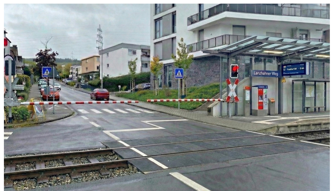
Der 2026 geplante neue Bahnübergang