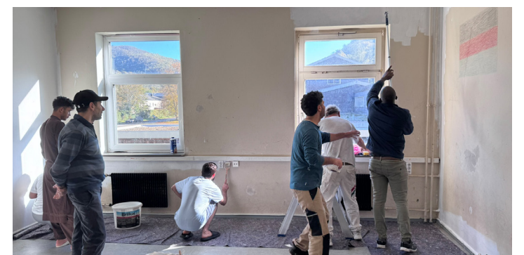
Renovierung durch Bewohnerinnen und Bewohner

werten die Unterkunft so Schritt für Schritt weiter auf. Die Bewohnerinnen und Bewohner der Gemeinschaftsunterkunft in Niedernhausen verwandelten einen vernachlässigten Sandkasten direkt vor ihrer Tür. Innerhalb eines Tages entfernten sie zusammen mit einem Unternehmen aus Idstein die beschädigten Holzeinfassungen, erneuerten die Betonfassung und gestalteten den angrenzenden Rasenbereich neu. Die Gemeinde Niedernhausen unterstützte das Projekt finanziell. Der neue Sandkasten kann nun sowohl von den Kindern aus der Unterkunft als auch von Kindern aus der Nachbarschaft unbeschwert genutzt werden.