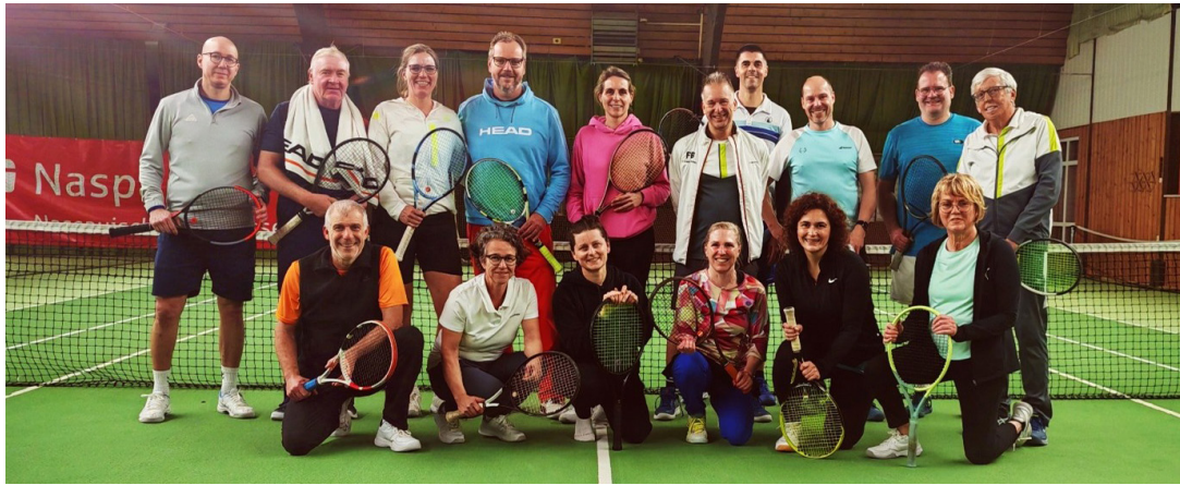
3. Mixed-Nachtturnier des Tennisclub Niedernhausen